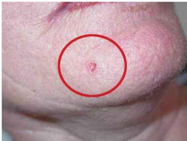
Basalcellekræfti assigiinngitsunik isikkoqarsinnaavoq

Basalcellekræfti: Timimiippat amerlanertigut ersiutaasoq tassaasarpoq ikeq aappalaartoq qalippersimasoq anaalaartartorlu.