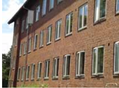
Ass.: J. Olsen