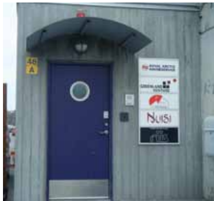
Ass.: J. Olsen

2100 København Ø Oq.: 0045 35 25 75 00 E-mail: info@cancer.dk Nittartagaq: www.cancer.dk