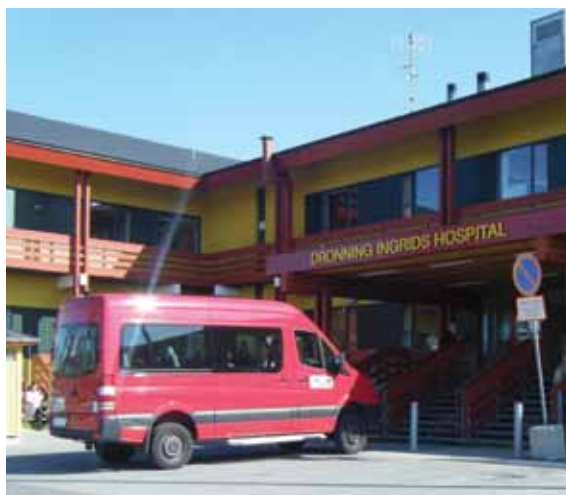
Ass.: J. Olsen