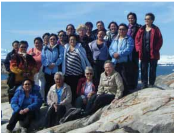
Neriuffimmi Avannaani oqaloqatiginnittartut pikkorissartut maj 2009.

Tarnit pissusaannik ilisimasalimmik oqaloqateqarnissamik pisariaqartitsiguit nakorsaq attaveqarfigisat oqaloqateqarnissamik kissaateqarfigissavat.