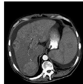
Tarrarsuinerup takutippaa massak talerpiata tungaaniittoq, aamma tinguk saamiata tungaaniittoq. Tingummi qaamanersat tassaapput tingummi kræftit.

Tarrarsuinerimi ilaatigut kræftip qanoq annertutigineranik eqqoqqissaarnerusumik killiffeqarnera takuneqarsinnaasarpoq, aamma tinunerit minnerusut nakorsap takusinnaasarlugit. Tarrarsuilluni misissuut assinik pitsaasunik tunisisarpoq, taakkulu nakorsap kingusinnerusumi atoqqissinnaavai, tassani pilattaanissamat pilersaarusiulernerimi imaluunniit allamik katsorsaalernermi. Amerlasoorpassuutigut tarrarsuilluni misissuinerimi takuneqarsinnaalereertarpoq ilumut tingummi nappaatip kræftip pileqqaarfigiaa.